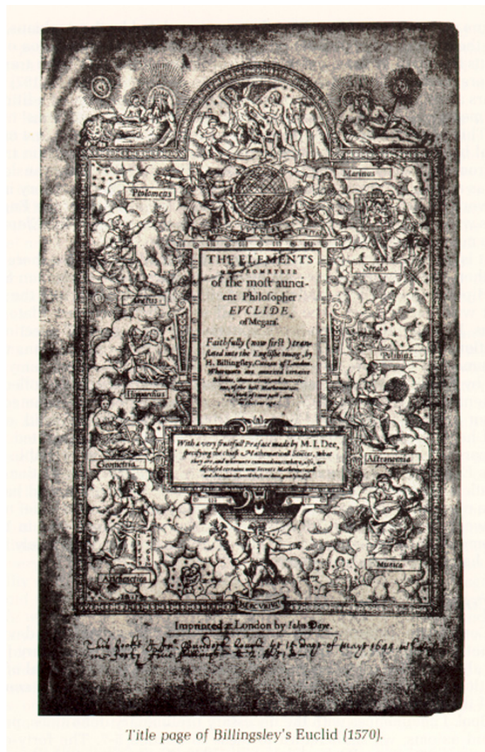
Προμετωπίδα της πρώτης αγγλικής μετάφρασης των Στοιχείων του Ευκλείδη από τον H. Billingsley (1570).