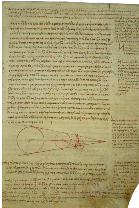
Σελίδα χειρογράφου του 10ου αιώνα, που περιέχει το έργο Περί μεγεθών και αποστημάτων Ηλίου και Σελήνης του Αρίσταρχου (αρχές 3ου π.Χ. αιώνα).