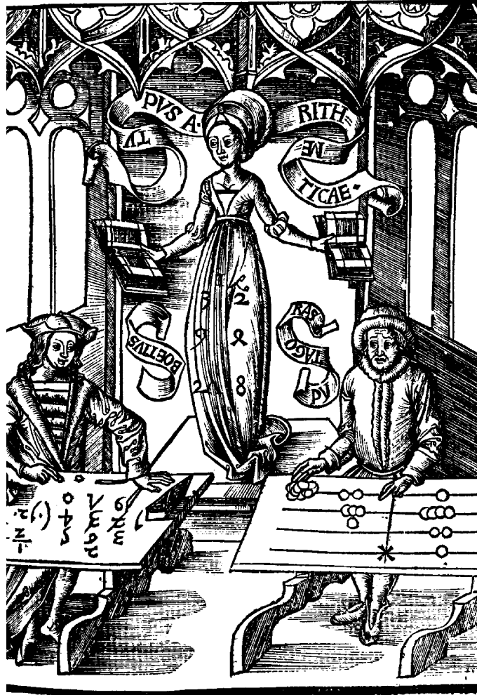
Πυθαγόρας και Βοήθιος. Από τη Marguerita philosophica του Gregor Reisch (1504).