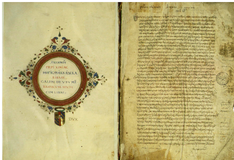
Πρώτες σελίδες χειρογράφου του 10ου ή 11ου αιώνα που περιέχει το έργο “Περί Χρείας” του Γαληνού (129–200).

Περισσότερες πληροφορίες παρέχονται από το Γραμματέα του Π.Δ.Σ. κ. Α. Ανδριόπουλο, τηλ. 210 727 5588, email_aandriop@phs.uoa.gr .